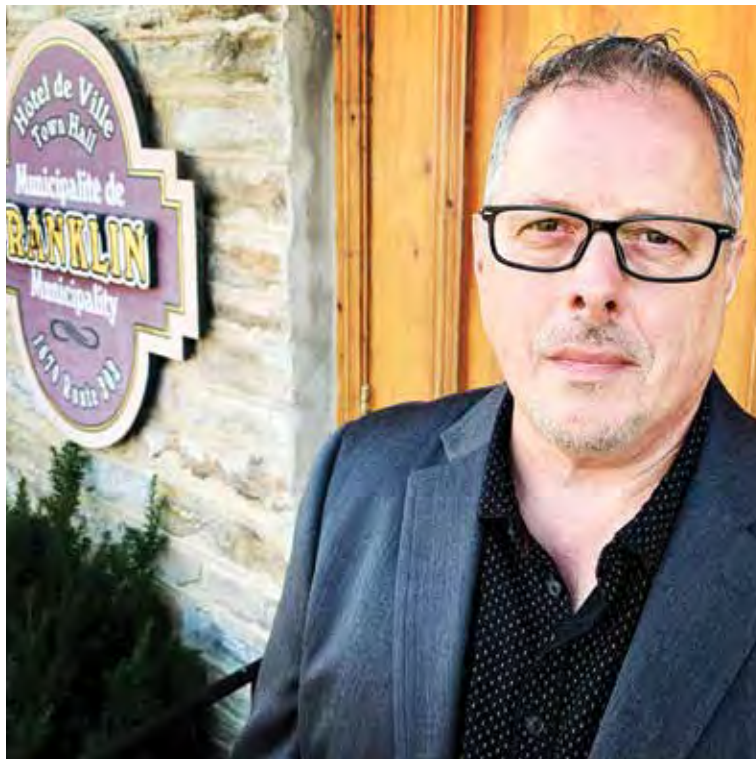
maire de Franklin