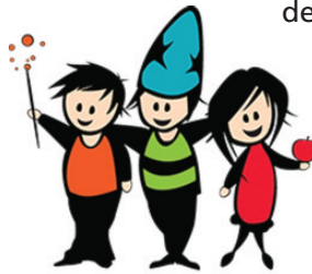
ABRACADABRA CENTRE DE LA PETITE ENFANCE

La Municipalité cohabite actuellement avec le CPE Abracadabra dans le Centre communautaire, les jours de semaine. Le Centre de la petite enfance au village de Saint-Antoine-Abbé est en rénovation et devrait pouvoir réintégrer ses locaux avant le printemps 2022. C'est pour cette raison, mais surtout avec les impacts de la pandémie que nous ne pouvons vous offrir encore cet espace vibrant d'activités à plein temps. Nous avons tout de même la chance de pouvoir profiter du talent de nos petits artistes en herbe qui s'occupent de la décoration intérieure du Centre communautaire.