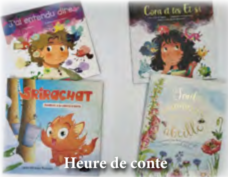
Heure de conte